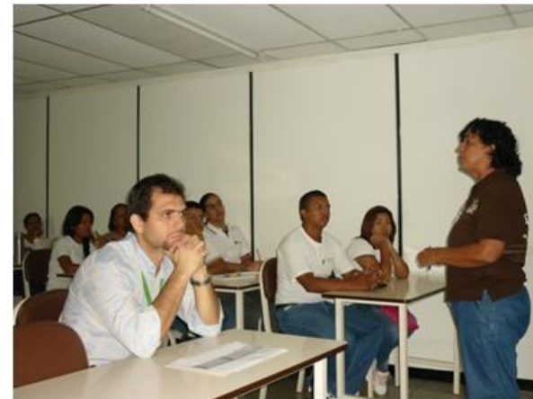
Convención Regional - Sub Campus Amazonas