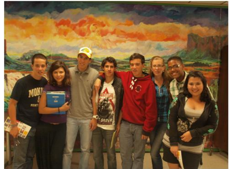
Parte del equipo de estudiantes que trabajó en El Baúl y Boconó