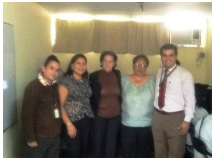
Autoridades de FLASA con personal del Centro de Formación