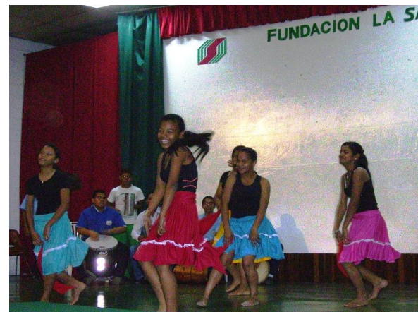
Acto cultural al final de la Convención Regional - Campus Guayana