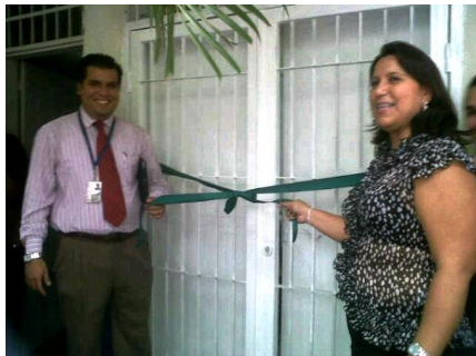
Apertura del Laboratorio de Computación