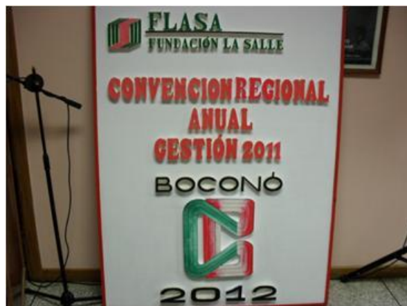
Convención Regional - Campus Boconó