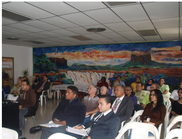
Convención Regional - Campus Caracas

Al final de todas las convenciones a nivel nacional, las autoridades de la Fundación La Salle manifestaron su satisfacción por el trabajo realizado en cada estado, a pesar de las continuas dificultades financieras que atraviesa la institución, e instaron a todo el personal a seguir manteniendo su compromiso y responsabilidad con la Misión de la institución, con miras a seguir trabajando al servicio de Venezuela, su gente y su ambiente.