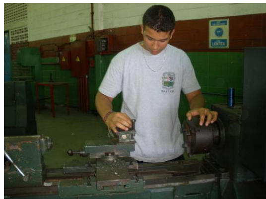
Un alumno en clases prácticas en uno de los talleres en el Campus Guayana.

En el Sub Campus Tumeremo, la carrera más demandada también es Seguridad Industrial, 151 alumnos optaron por esta especialidad. Mientras que el resto de los 431 inscritos en esta sede iniciaron el semestre en las carreras de Contabilidad y Finanzas, Electricidad y Tecnología Minera.