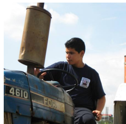
Estudiante de Tecnología Pecuaria en el IUT de San Carlos, estado Cojedes.

El segundo campus con mayor demanda es la sede principal del Instituto Universitario de Tecnología del Mar en Margarita con 758 alumnos, los cuales se dividen entre las carreras de Acuicultura y Oceanografía, Administración de Empresas, Contabilidad y Finanzas, Mecánica Naval, Navegación y Pesca y Tecnología de Alimentos.